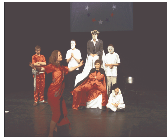
Premiera przedstawienia pt “Estera “ w Zittau.